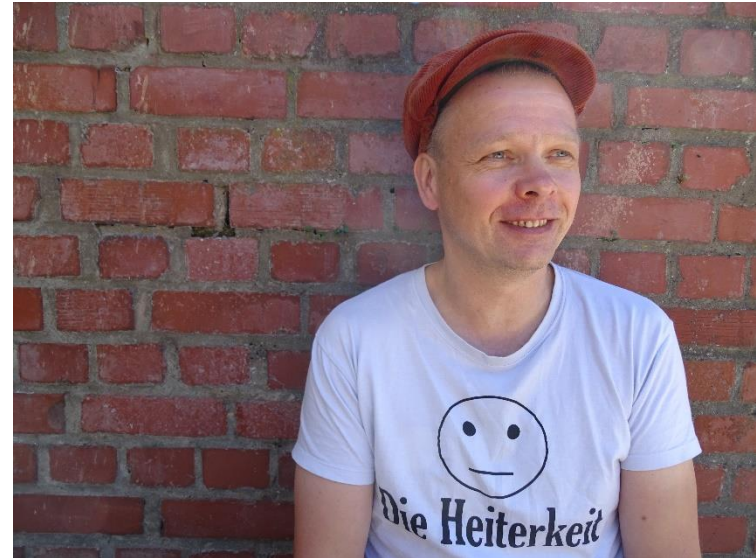
Christian, Schauspieler und Theaterpädagoge

„Wenn ich eine Rolle spiele, kann ich so sein, wie ich sonst nicht bin.“